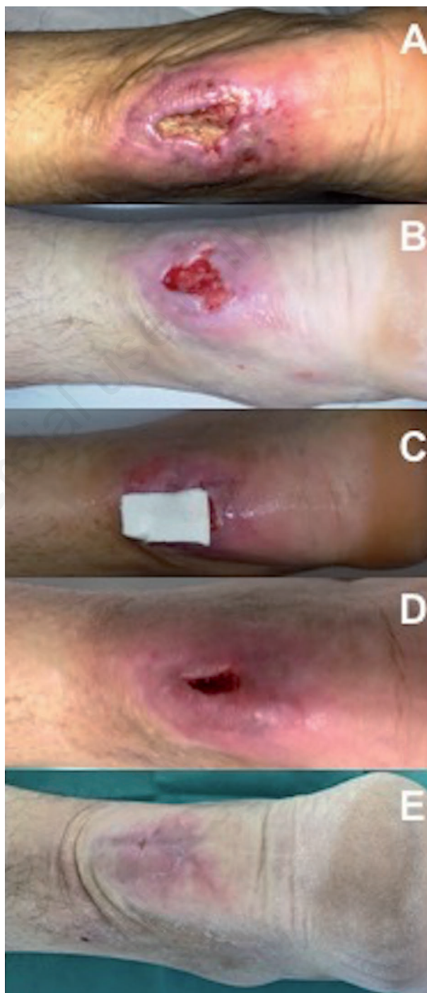
Figura 2. Deiscenza della ferita con esposizione del tendine di Achille (A); dopo un'adeguata preparazione del letto della ferita è stata applicata una matrice di Bionect Pad (B-C). Visita di follow-up dopo 50 giorni (D); la guarigione completa della ferita è stata ottenuta dopo 76 giorni (E).

di altri materiali (ad esempio i derivati del chitosano). Tuttavia, la resistenza in vivo degli impianti a base di AI e dell'AI iniettato, dipende dalla loro capacità di resistere