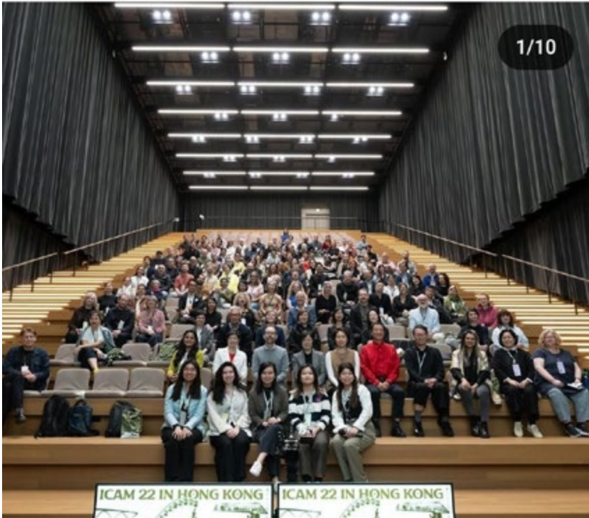
Figura 11. ICAM22, M+, Hong Kong, dicembre 2024, visita alle collezioni di architettura (foto ICAM).