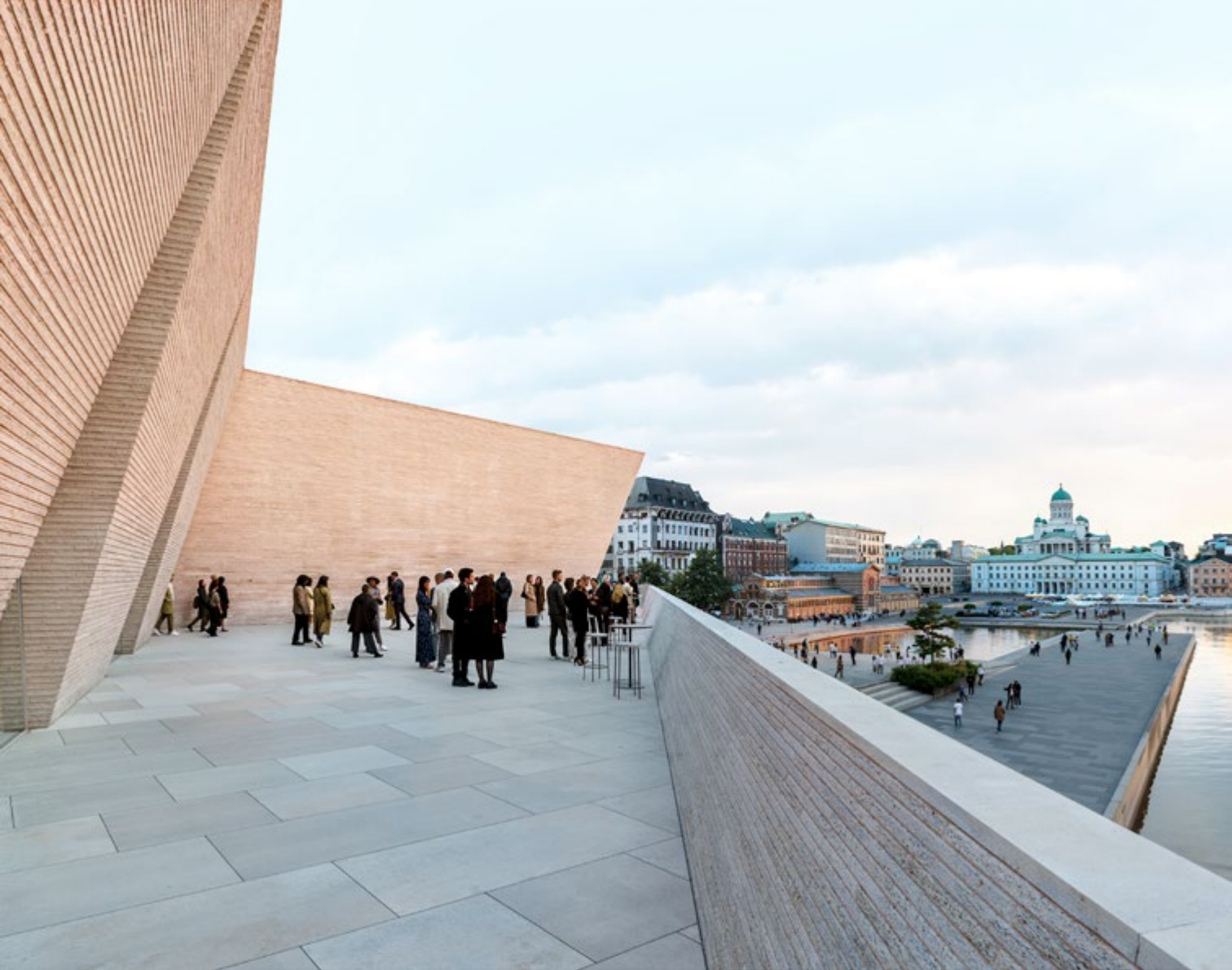
Figura 10. JKMM architects, Kumma, progetto vincitore del concorso, veduta dalla terrazza di copertura, 2025.