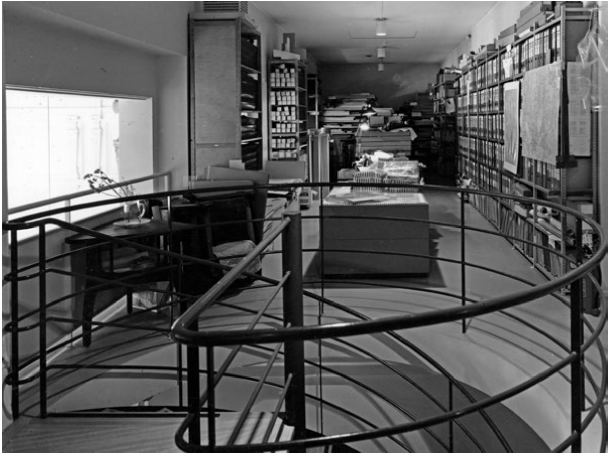
Figura 6. Museo dell'architettura finlandese, Kasarmikatu 24, Helsinki, archivio disegni, modelli e collezioni fotografiche, piano mezzanino (foto K. Hakli, 1988, Architecture & Design Museum, archive).