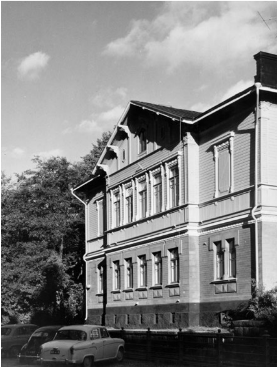
Figura 2. Museo dell'architettura finlandese, Puistokatu 4, Helsinki.