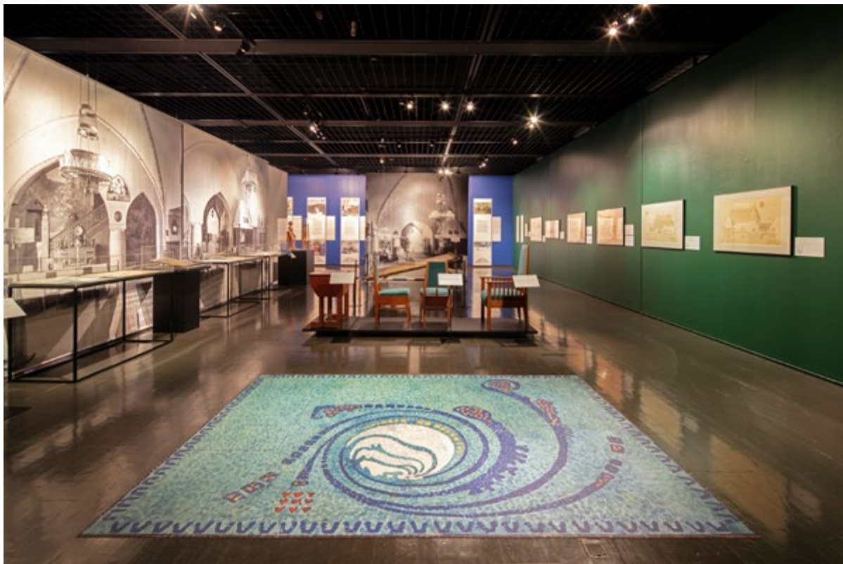
Figura 1. Eliel Saarinen, Suur-Merijoki Manor exhibition, 2019.

diecimila fotografie di architettura contemporanea. È stato decisivo nel 1952 il lascito dell'archivio professionale di Eliel Saarinen (1873-1950), voluto dalla vedova Loja (fig. 1). Oltre 250 disegni, un primo nucleo che in seguito si è arricchito, a testimoniare l'opera di uno dei principali protagonisti dell'avanguardia culturale del Paese negli anni della ricerca dell'indipendenza dalla Russia, tra il 1890 e il 1910. Le sue idee e opere hanno segnato le tappe principali della definizione di un'architettura autonoma e identitaria 21 . Il contributo di Alvar Aalto, che suggerisce un programma molto chiaro in