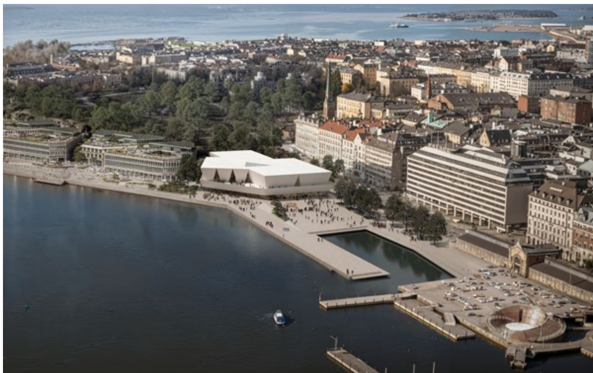
Figura 9. JKMM architects, Kumma, progetto vincitore del concorso, veduta della baia, 2025 (@JKMM architects)