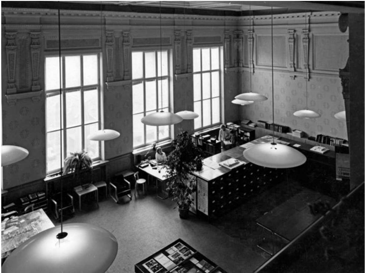
Figura 5. Museo dell'architettura finlandese, Kasarmikatu 24, Helsinki, uffici e mostra permanente al terzo piano.