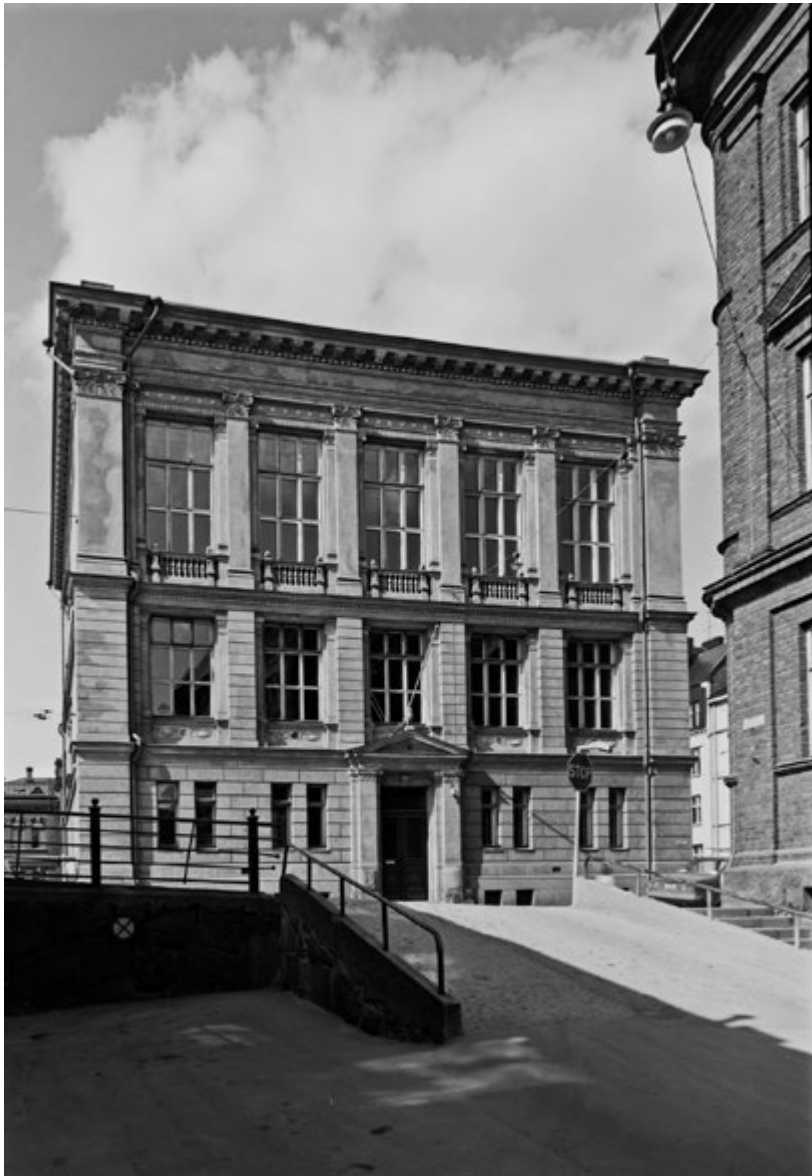
Figura 3. Museo dell'architettura finlandese, Kasarmikatu 24, Helsinki (foto K. Hakli, 1980, Architecture & Design Museum, archive).