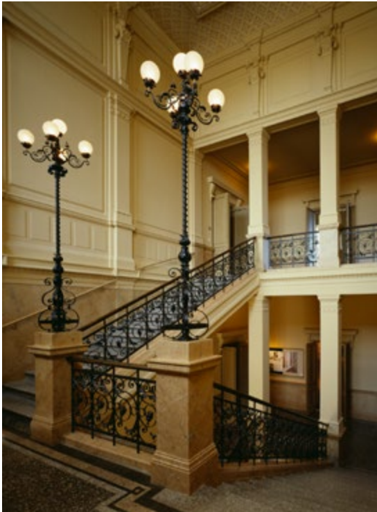
Figura 4. Museo dell'architettura finlandese, Kasarmikatu 24, Helsinki, il corpo scala.

a pochi isolati dal grande viale Esplanadi, è al margine opposto del Museo delle Arti Applicate (oggi Museo del Design), fondato nel 1873 e ospitato in un ex edificio scolastico della stessa epoca e stile, progettato nel 1895 da Gustav Nyström (1856-1917). Si è dovuto attendere oltre un decennio per la ristrutturazione e allestimento, a causa di ritardi burocratici ma soprattutto per mancanza di fondi. Dunque, il trasferimento è avvenuto soltanto a febbraio 1982 ed è tutt'oggi la sede del museo. Si tratta di un edificio di tre piani con seminterrato: il piano terra ospita il dipartimento della ricerca, la biblioteca, che occupa anche il piano seminterrato, e il bookshop; il piano intermedio ospita le mostre temporanee, il piano più alto l'amministrazione e gli archivi (figg. 3-6). Ben presto lo spazio si è rivelato insufficiente sia per contenere le collezioni in continua crescita che per ospitare le mostre, così come per l'assenza di un auditorium che potesse ospitare convegni di un certo rilievo.