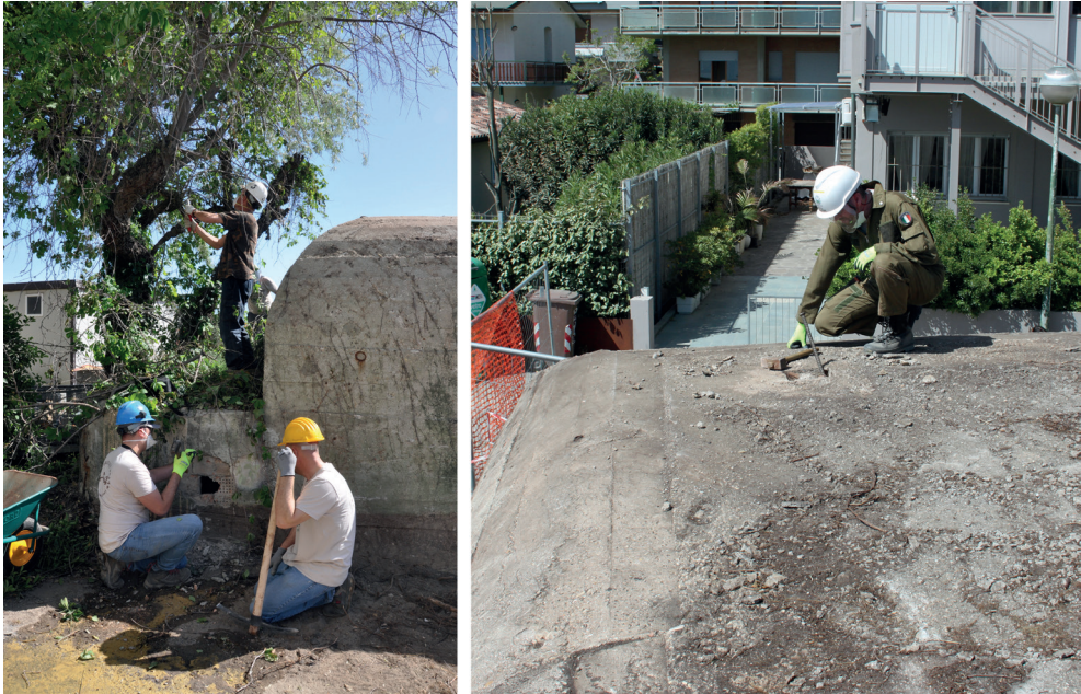
Fig. 5. Linea Galla Placidia. Le attività di “cura” dei bunker svolte dai volontari del CRB360° (crediti: ©Autori, 2021)