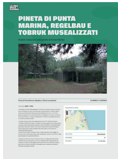
Fig. 6. Geoapp La Linea Galla Placidia : localizzazione e scheda anagrafica di un bunker (Regelbau e Tobruk), sito nella pineta di Punta Marina Terme (RA)