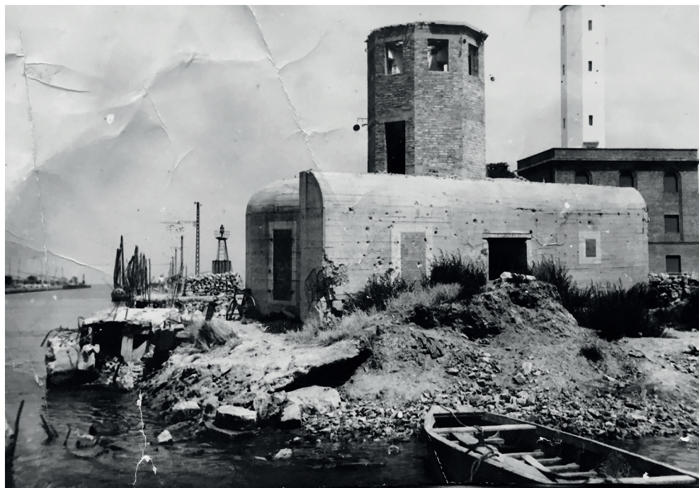
Fig. 1. Linea Galla Placidia. Marina di Ravenna (RA), foto storica del bunker eretto a difesa del porto, oggi distrutto