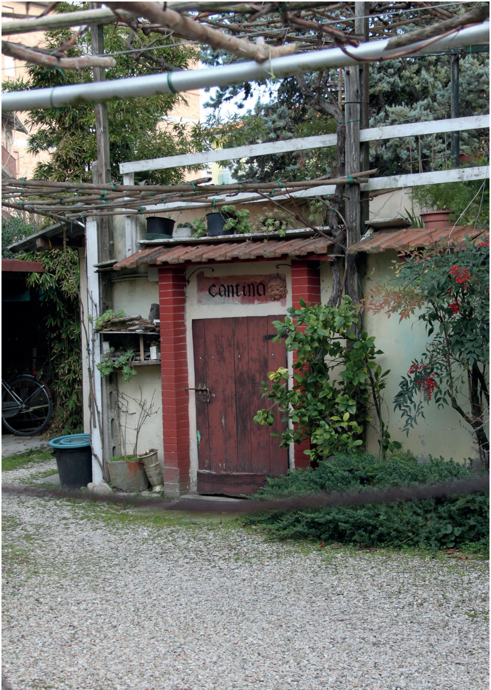
Fig. 2. Linea Galla Placidia. Lido di Savio (RA), Tobruk situato in un'area di proprietà privata, oggi adibito a cantina (crediti: ©Autori, 2018)