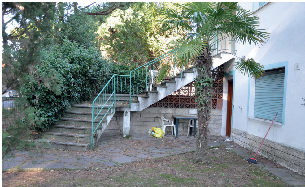
Fig. 4. Linea Galla Placidia. Cervia (RA), bunker a servizio di un'abitazione, oggi demolito