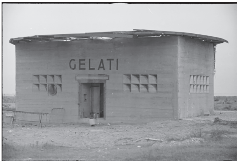
Fig. 3. Linea Galla Placidia. Dintorni di Rimini, bunker mimetizzato per sembrare un comune esercizio commerciale attraverso la dipintura di porte, finestre e di un'insegna "gelati"